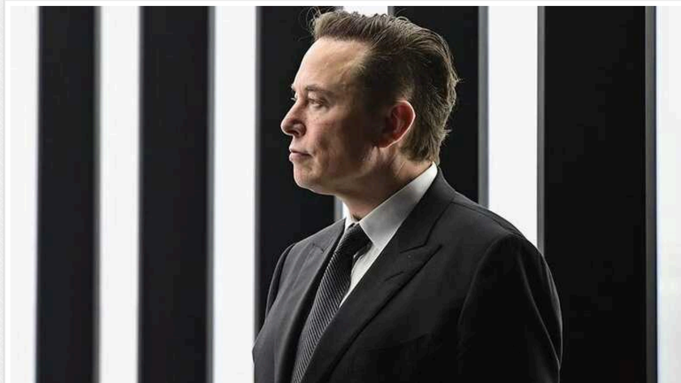
Бізнесмен Ілон Маск вкотре закликав до якнайшвидшого припинення війни в Україні

"Час зупинити цю м'ясорубку. Це потрібно було зробити ще рік тому", - написав Маск у Х.