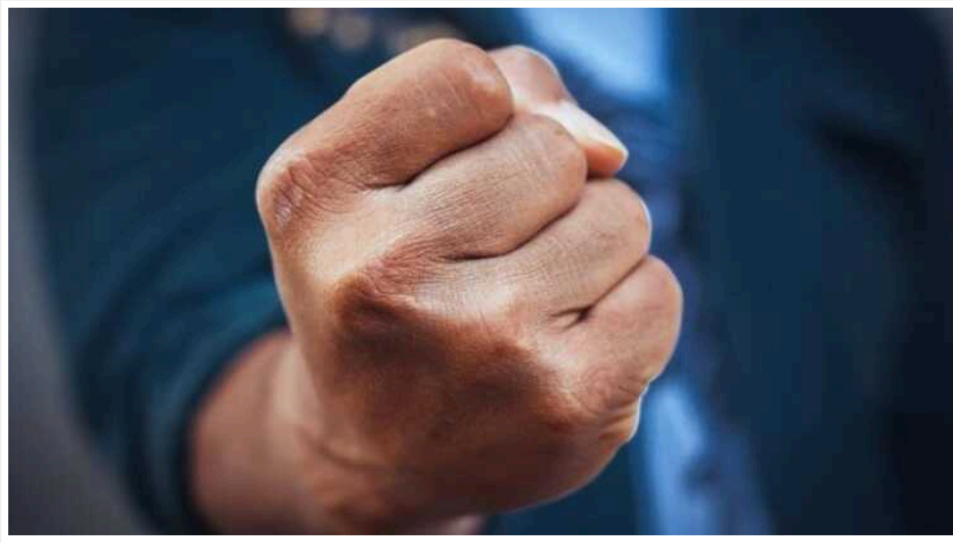
На Буковині чоловіків, які побили журналіста, покарали умовно

Вижницький районний суд Чернівецької області визнає двох громадян винними у насильстві щодо журналіста.