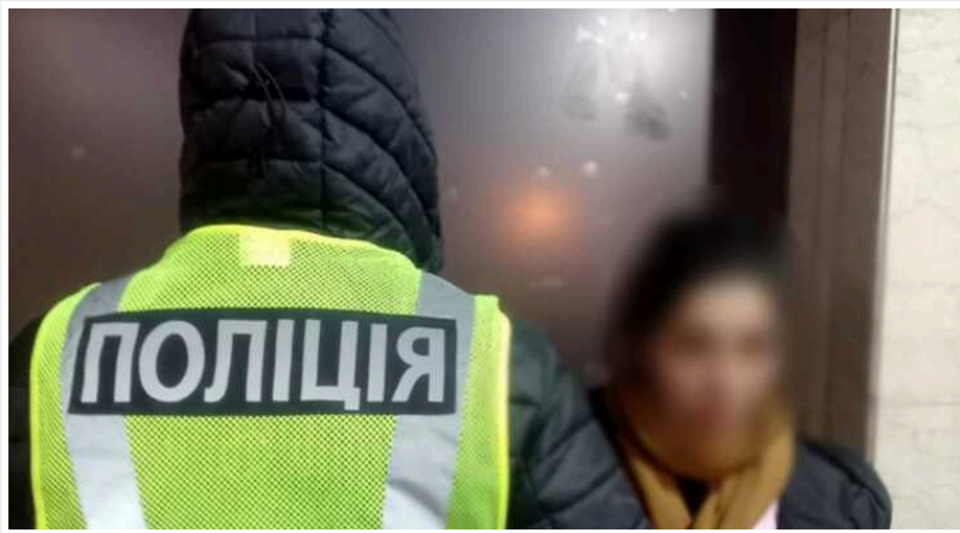
У столиці затримали уродженку Закарпаття за серію кишенькових крадіжок

Зловмисниця нещодавно приїхала до Києва та протягом декількох днів обікрала трьох жінок. Поліцейські спіймали порушницю під час вчинення нею чергової крадіжки. Їй загрожує до восьми років позбавлення волі.