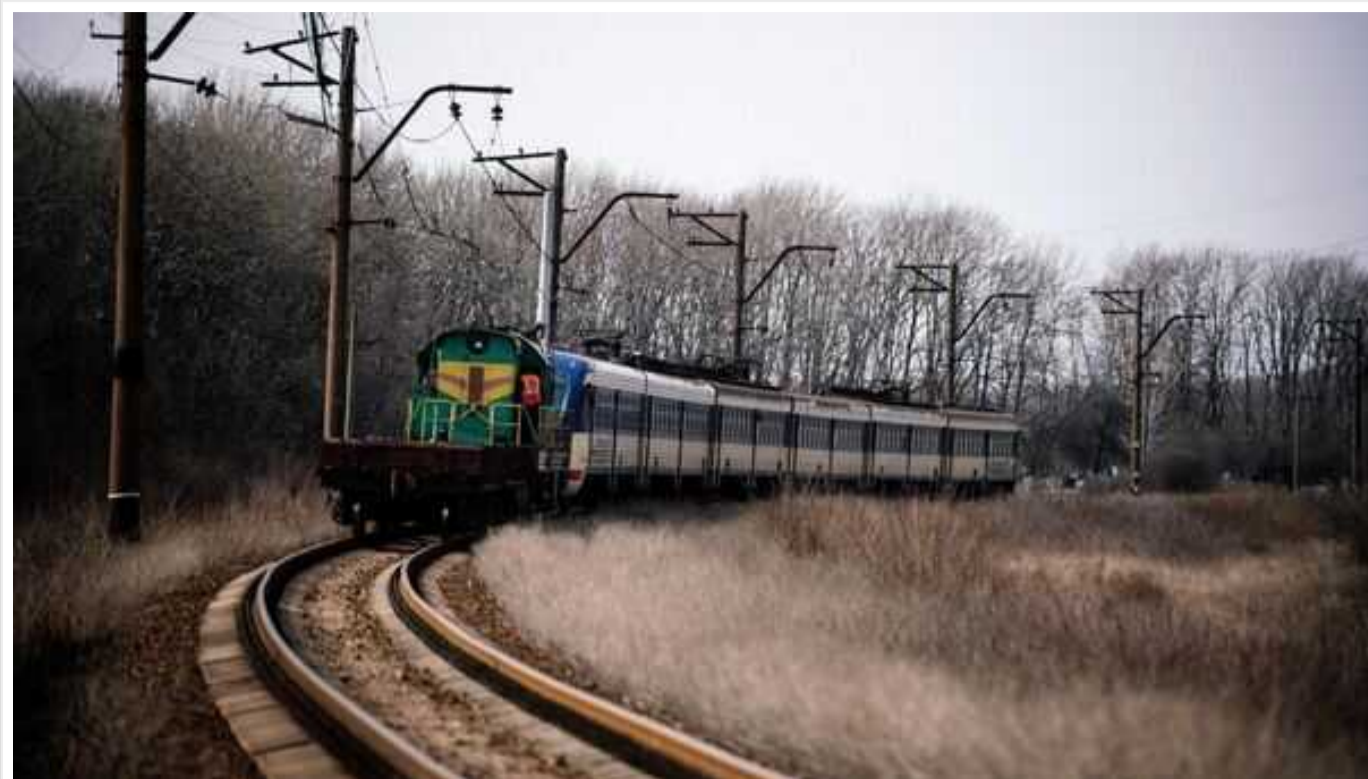
Окупанти досягли залізничної розв'язки у центрі Авдіївки і знаходяться всього за 700 метрів від останнього маршруту постачання ЗСУ, - Рьопке

Про це в X пише військовий аналітик Bild Юліан Рьопке.