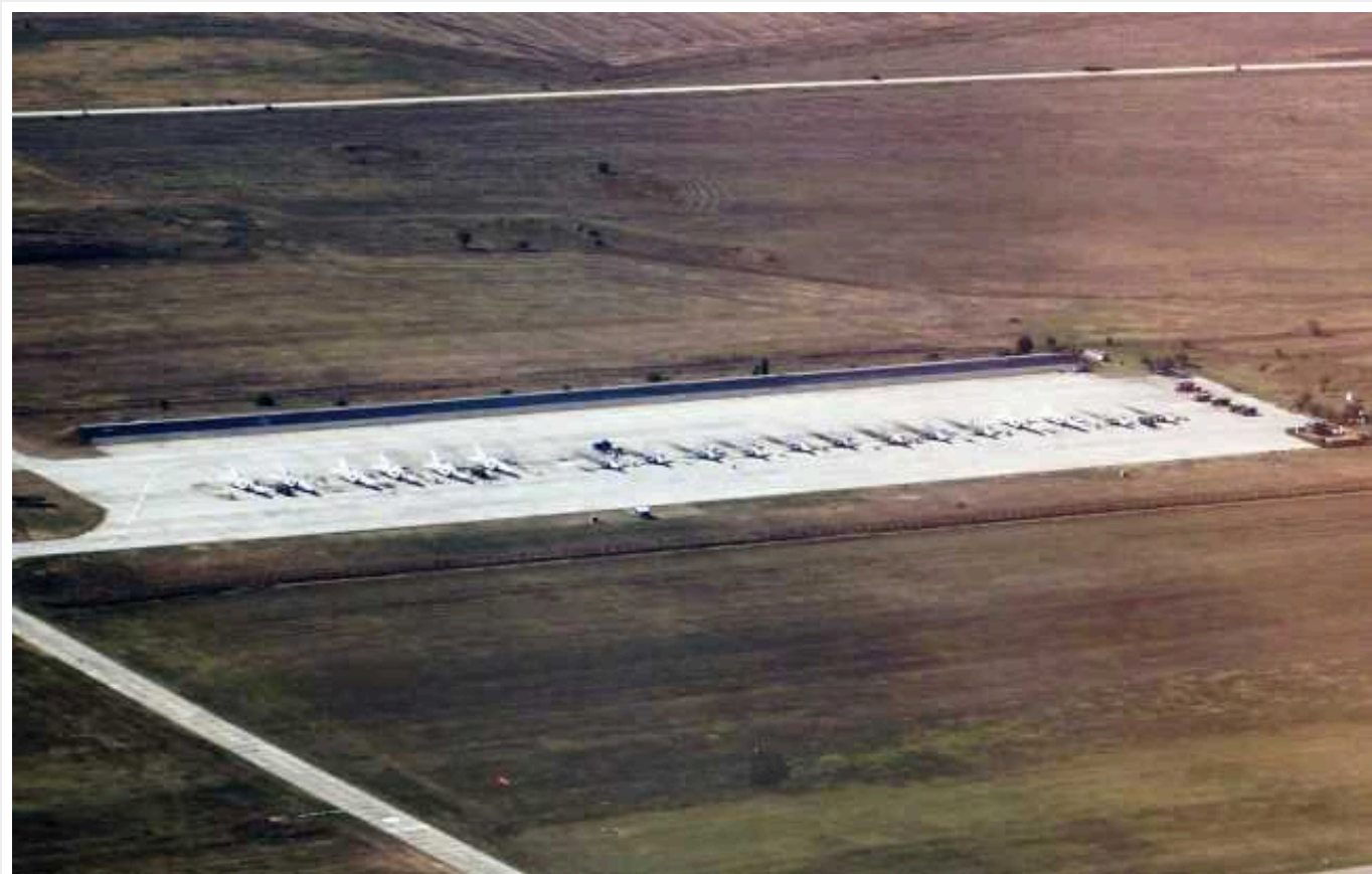
Британська розвідка оцінила удари України по аеродрому Бельбек

Розвідувальне співтовариство Міністерства оборони Великої Британії оцінює, що останній удар сил України по аеродрому Бельбек в окупованому Криму ще більше підірвав потенціал російської авіації.