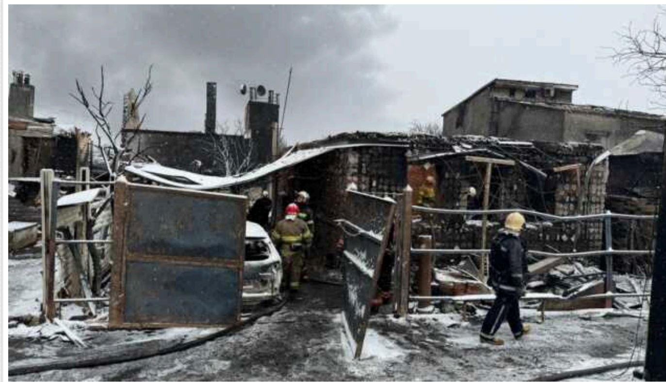
У Харкові проводять пошуки загиблого немовляти внаслідок атаки БПЛА

У Харкові шукають тіло загиблого від атаки ворожих безпілотників немовляти, який разом із батьками та двома братиками згоріли живцем.