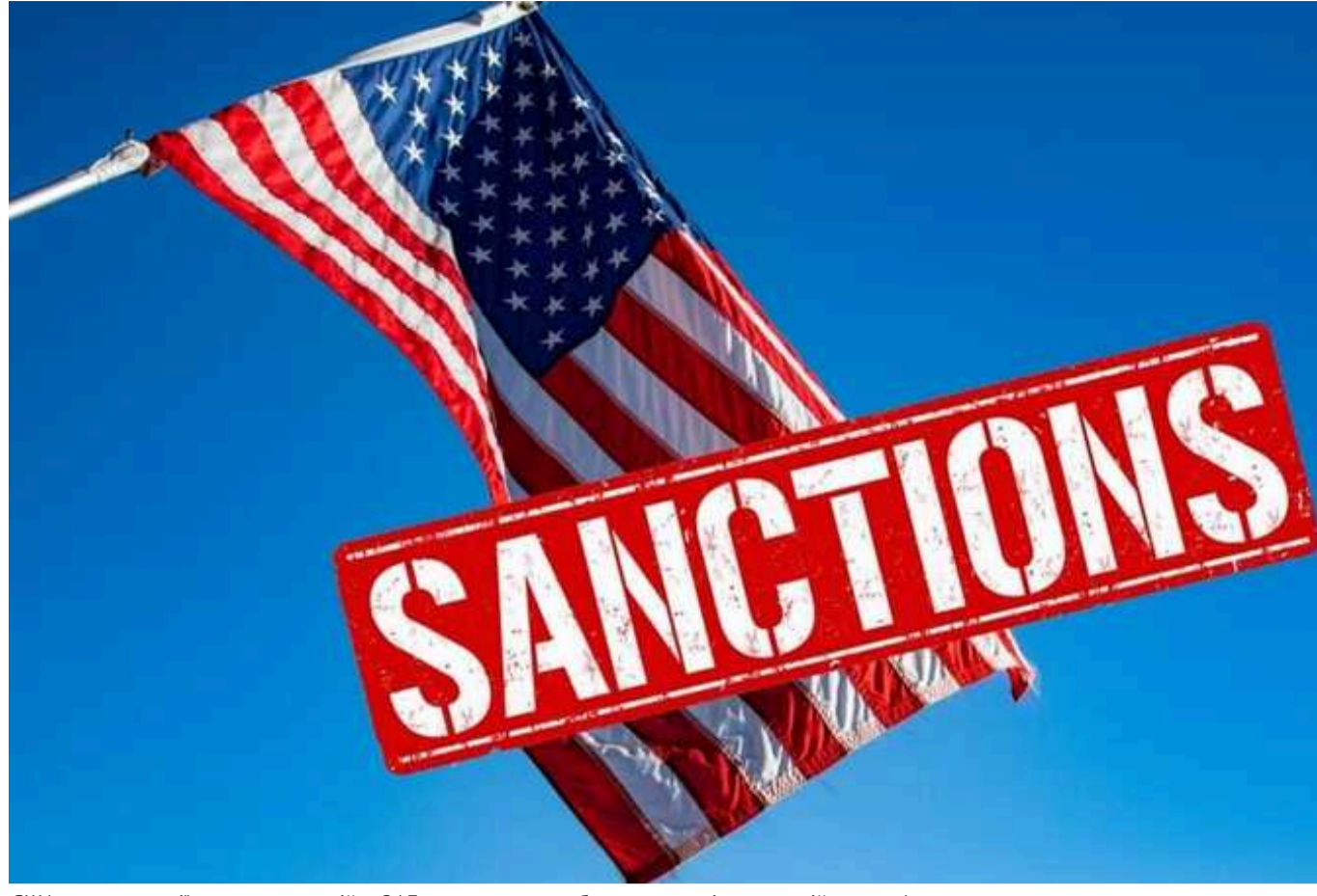
США ввели санкції проти компаній з ОАЕ за порушення обмежень на ціни на російську нафту

Міністерство фінансів США запровадило санкції проти трьох компаній з Об'єднаних Арабських Еміратів та одного танкера, зареєстрованого в Ліберії, за порушення запровадженого західними країнами обмеження цін на російську нафту.