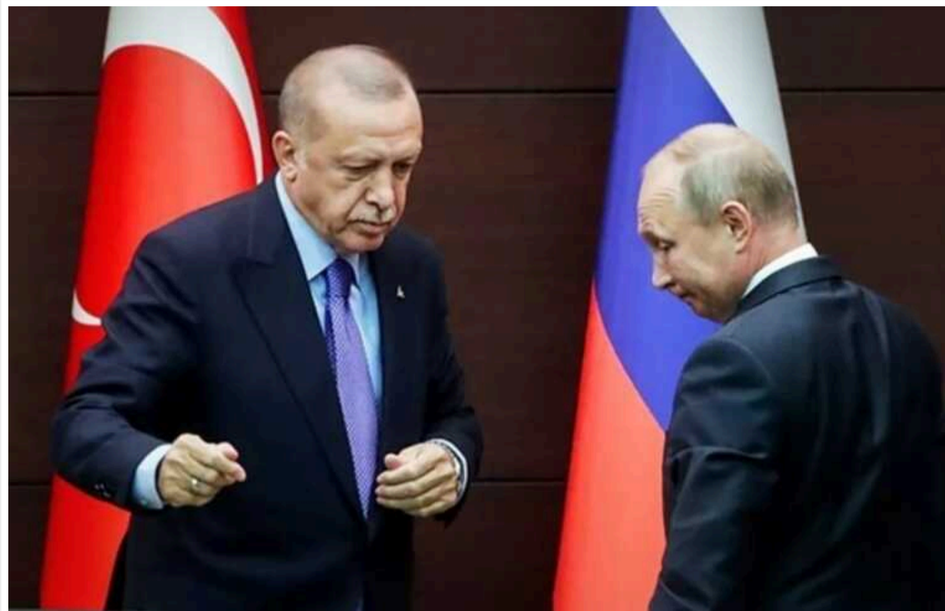
Туреччина під час візиту Путіна готується запустити мирні переговори РФ та України

У ході запланованого візиту президента країни-терористки РФ Володимира Путіна до Туреччини Анкара має намір запропонувати йому розпочати мирні переговори з українським Президентом Володимиром Зеленським, розповіло пропагандистському рупору Кремля РІА Новости турецьке дипломатичне джерело.