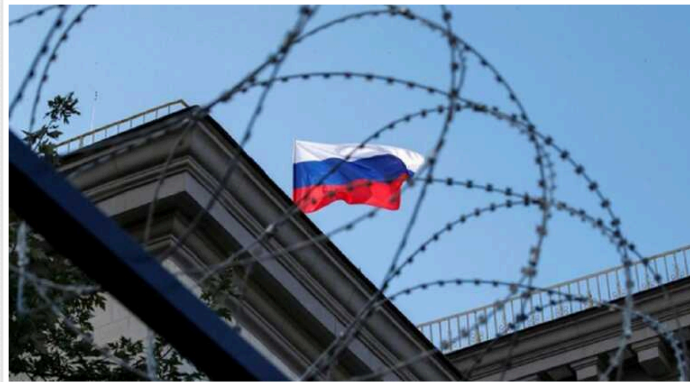
Сім країн ЄС закликали Єврокомісію представити секторальні санкції проти Росії та скоротити торгівлю з Москвою

Сім країн-членів Європейського союзу звернулися до Європейської комісії із закликом підготувати пропозицію з новими обмежувальними заходами щодо Росії.