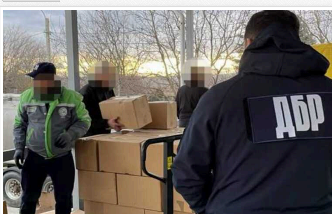
ДБР вилучила на Буковині з цистерни бензовоза контрабандні сигарети на 12 мільйонів гривень

Співробітники Державного бюро розслідувань на Буковині викрили та вилучили велику партію контрабандних цигарок, які намагалися ввезти до Єврозоюзу у цистерні бензовоза. Зловмисники користувалися такою схемою перевезення з липня 2023 року, повідомили у суботу, 10 лютого, у прес-службі ДБР.