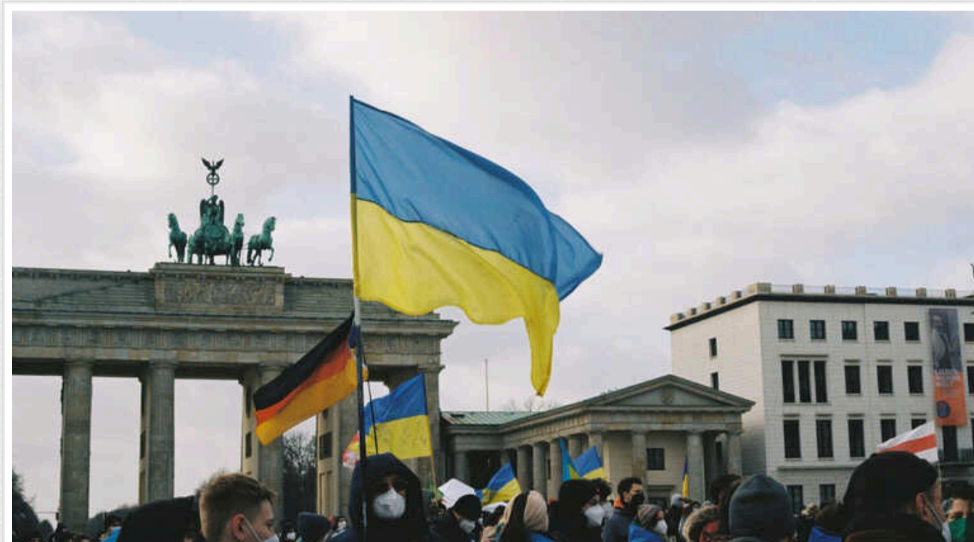
У Німеччині прогнозують ще 10 мільйонів біженців з України у разі перемоги Росії у війні, - ЗМІ

Німецький федеральний уряд прогнозує, що в разі найгіршого розвитку подій в Україні й перемоги Росії кількість українських біженців зросте на 10 мільйонів, і Німеччина буде однією з країн їхнього призначення.