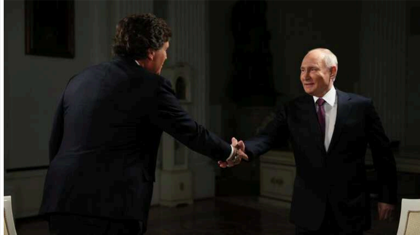
NYT: Американці вражені довжиною монологу Путіна про історію Росії в інтерв'ю Карлсону

Він не зміг донести республіканцям головного послання.