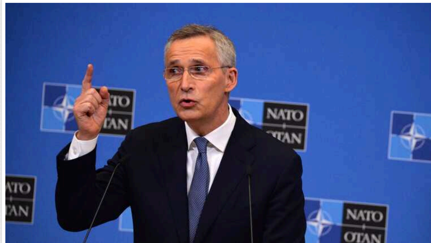
Маємо готуватись до десятиліть конфронтації з РФ, - Столтенберг

Генеральний секретар Північноатлантичного Альянсу Єнс Столтенберг вважає, що в разі перемоги Росії в Україні російська агресія може поширитися на інші країни, тож членам НАТО потрібно активно готуватись до можливої конфронтації.