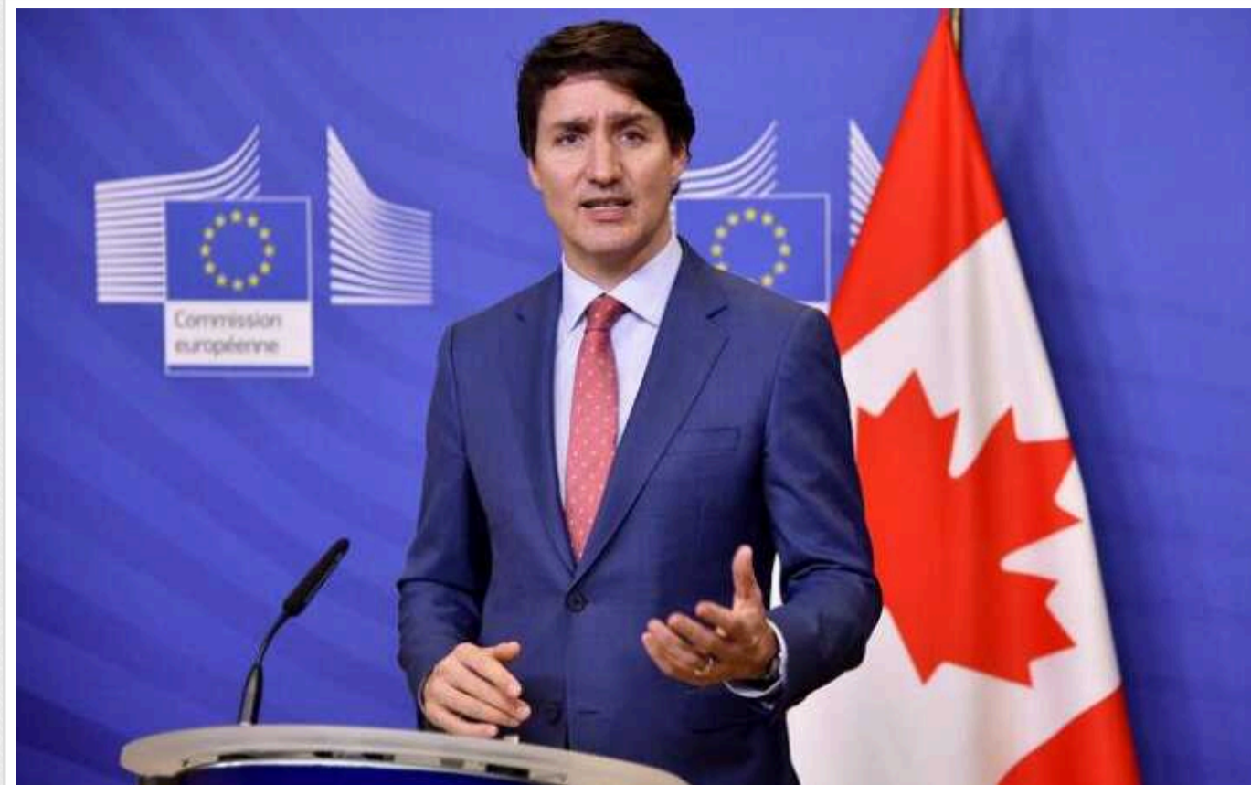
Прем'єр Канади запевнив, що Путіну не вдасться вести в оману канадців своїм інтерв'ю Карлсону

Прем'єр-міністр Канади Джастін Трюдо заявив, що канадці не піддадуться впливу пропаганди, яку російський диктатор Володимир Путін намагався донести до Заходу через інтерв'ю одіозному журналісту Такеру Карлсону. За його словами, ватажок Кремля всіма способами продовжуватиме намагатися виправдати агресію проти України.