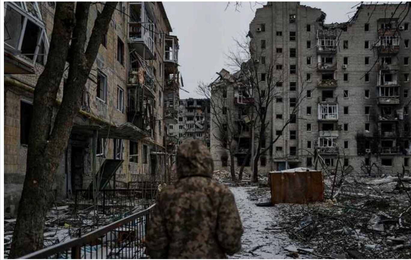
Аналітик: В Авдіївці "повторюється історія з Бахмутом", і є загроза оточення українських сил у місті