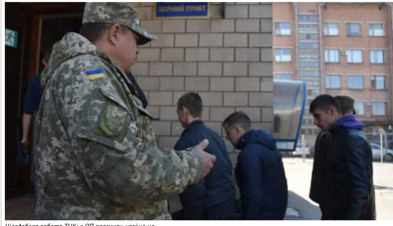
Цілодобова робота ТЦК: в ОП пояснили, навіщо це

За словами радника голови ОП Михайла Подоляка, необхідно перебудувати роботу ТЦК, щоб забезпечити ефективні процеси ротації та додаткового комплектування війська.