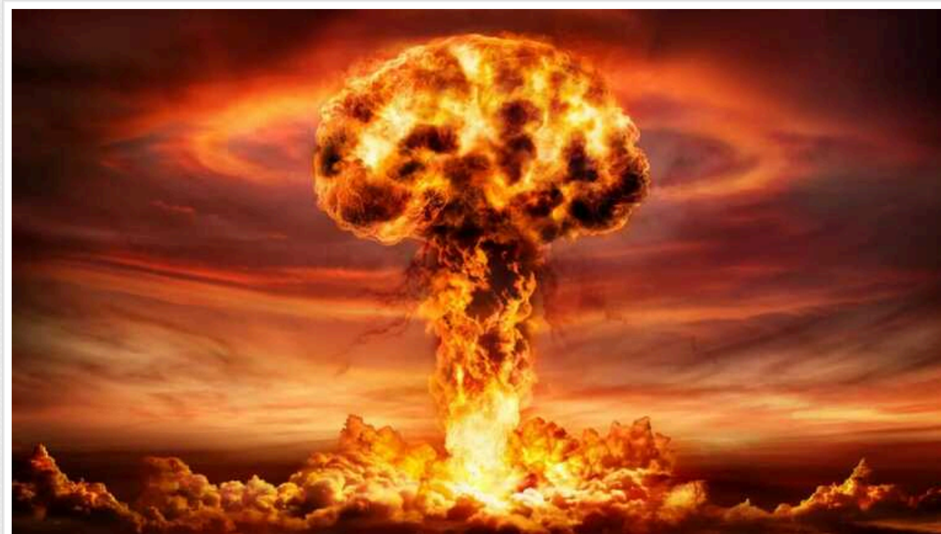
Штучний інтелект довів світ до ядерної війни, - дослідження