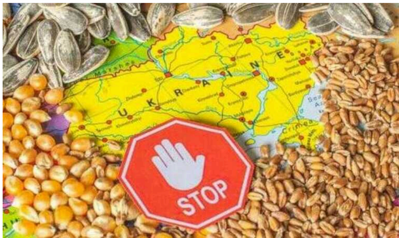
У Польщі хочуть заблокувати товари з України через Єврокомісію

Деякі сфери, на думку польського міністра, потребують повного блокування імпорту, зокрема це стосується зернових.