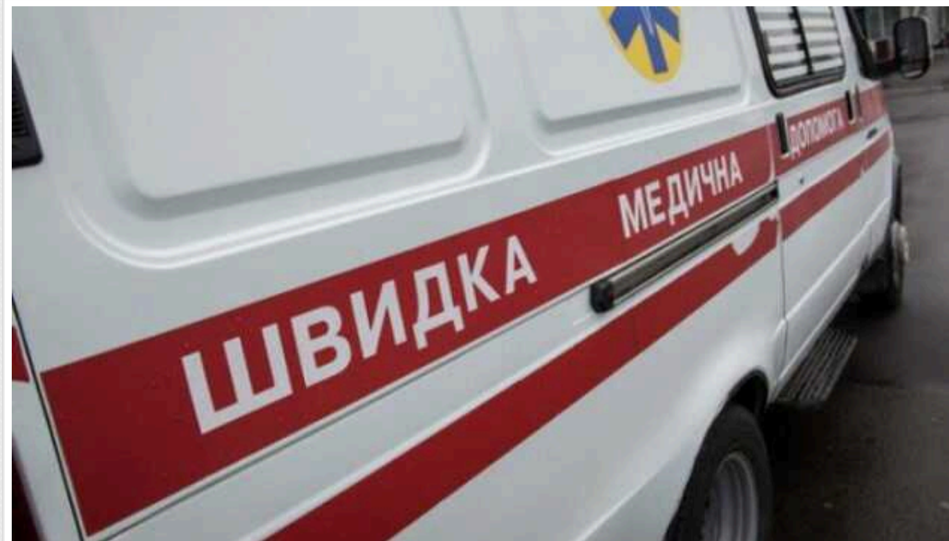
На Миколаївщині чоловік намагався сокирою розібрати боєприпас: він загинув від вибуху

На Миколаївщині чоловік приніс додому боєприпас та намагався його розібрати за допомогою сокири. Внаслідок вибуху снаряда він загинув на місці.