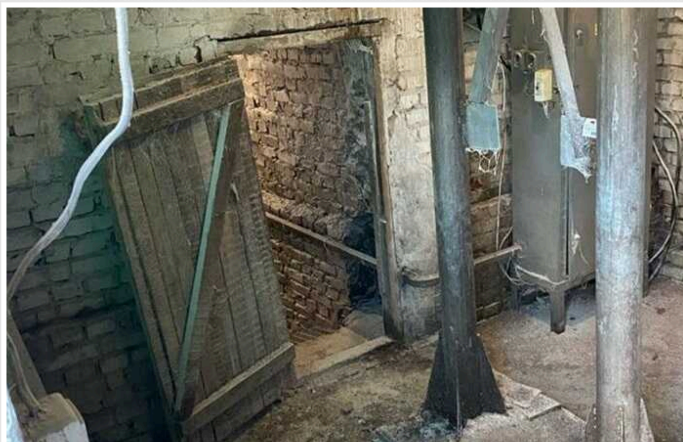
СБУ встановила особи ще 5-х російських окупантів, які катували мирних жителів під час окупації Сумщини

Служба безпеки ідентифікувала ще п'ятьох російських військових, які вчиняли воєнні злочини проти цивільного населення у період тимчасової окупації Сумщини.