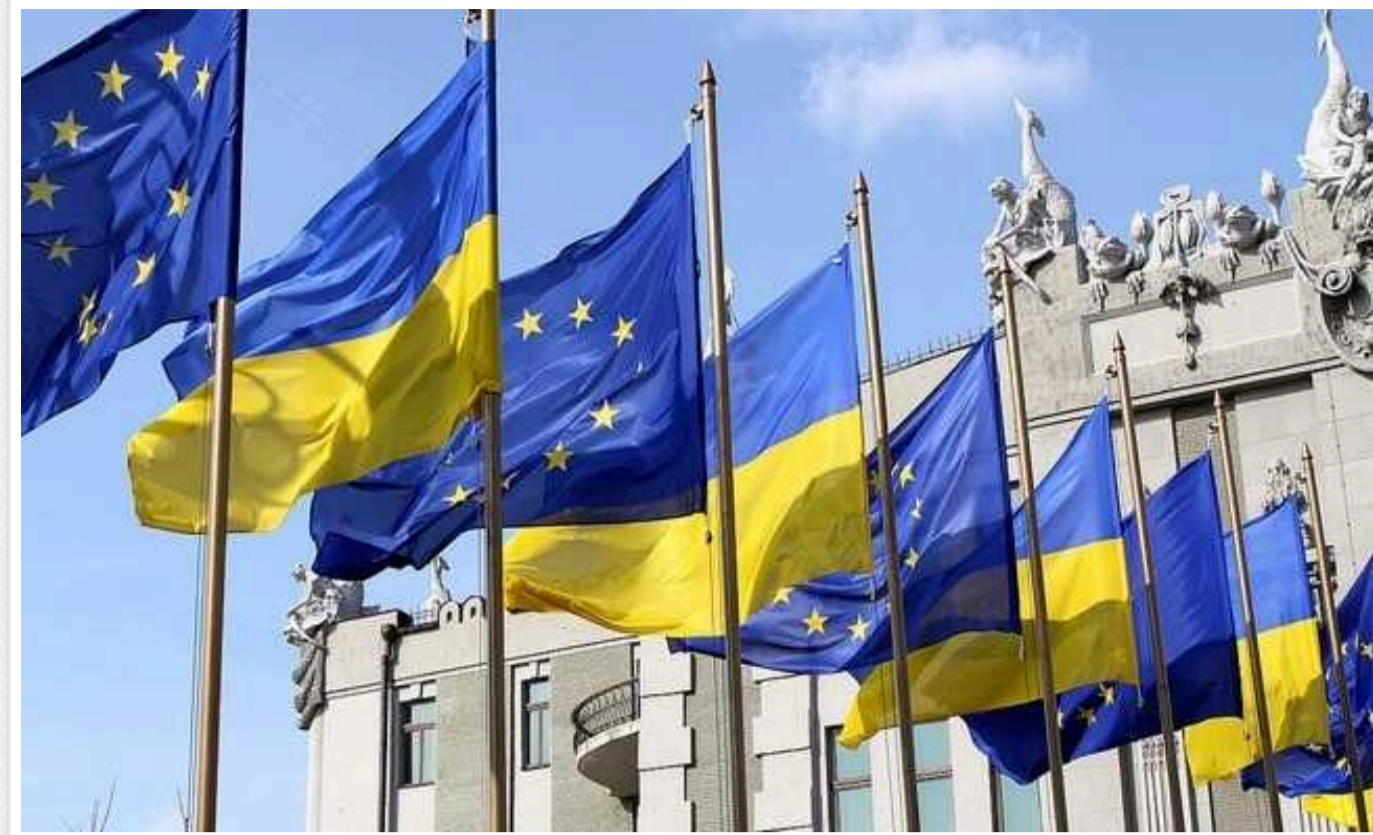
Вступ України до ЄС: Кабмін затвердив план виконання рекомендацій Єврокомісії

Кабінет міністрів на засіданні у п'ятницю, 9 лютого, затвердив план заходів з виконання рекомендацій Європейської комісії для початку переговорів щодо членства України в ЄС.