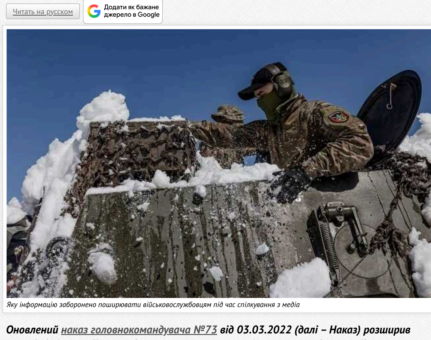
Яку інформацію заборонено поширювати військовослужбовцям під час спілкування з медіа

Оновлений наказ головнокомандувача №73 від 03.03.2022 (далі – Наказ) розширив перелік інформації, яку заборонено поширювати військовослужбовцям під час спілкування з медіа, згідно з додатком 2 до цього Наказу.