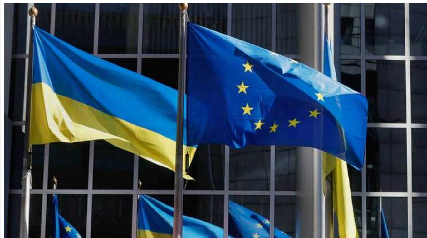
Євросоюз наступного тижня може доповнити список осіб, проти яких готують санкції до 24 лютого, - ЗМІ

Перелік осіб і компаній, які можуть опинитися у санкційному списку ЄС у рамках 13-го пакету санкцій, може наступного тижня доповнитися.