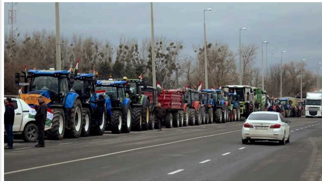
В Угорщині фермери протестують на кордоні з Україною біля КПП "Захонь"

Фермери Угорщини у п'ятницю, 9 лютого, вийшли на акцію протесту біля КПП "Захонь" на кордоні з Україною: виступають проти рішення Єврокомісії продовжити безмитне ввезення української продукції.