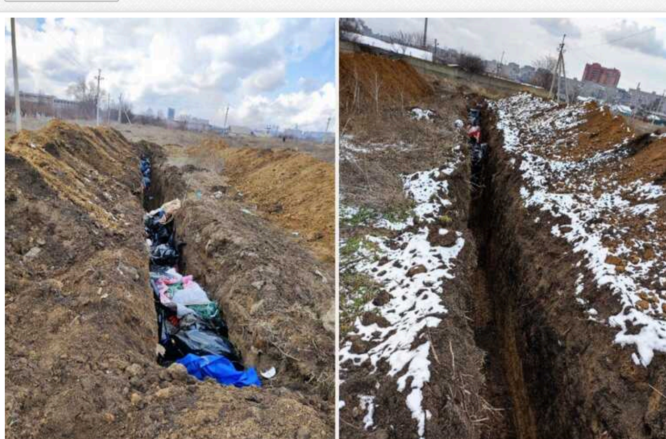
Сімейки ж мирних людей загинули в Маріуполі, і як за це покарати Путіна

Міжнародна правозахисна організація Human Rights Watch оприлюднила нову інформацію про руйнування та кількість жертв у Маріуполі. За даними їхнього звіту, за перший рік війни в місті загинули щонайменше 8 тисяч людей, повідомляє ВВС.