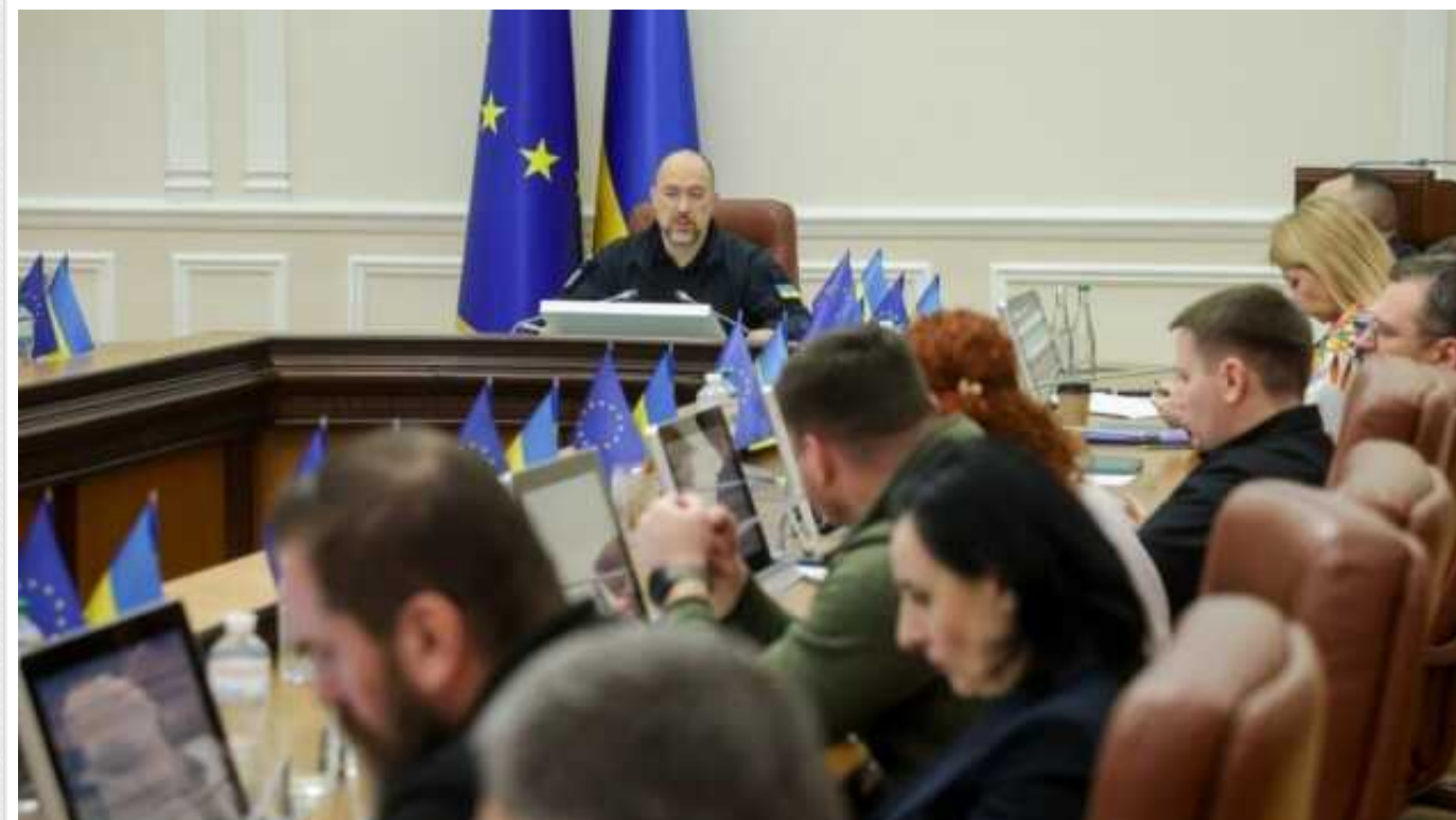
Кабінет міністрів ухвалив методологію використання мов нацменшин у місцях проживання

Кабінет Міністрів ухвалив методологію використання мов національних меншин там, де вони традиційно та компактно проживають.