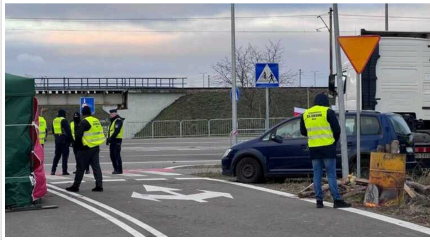
У Польщі почалися страйки місцевих фермерів

Трактори перекривають дороги. Також протестувальники заблокували рух через кордон. Місцями – навіть звичайних громадян.