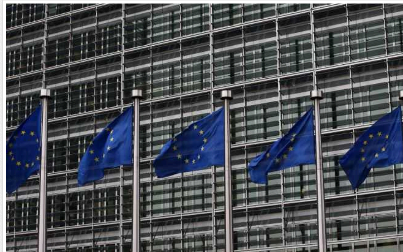
Єврокомісія назвала терміни надання умов для переговорів щодо вступу України до ЄС

Єврокомісія розраховує протягом найближчих тижнів бути готовою надати рамкові умови для переговорів про вступ України в Європейський союз.