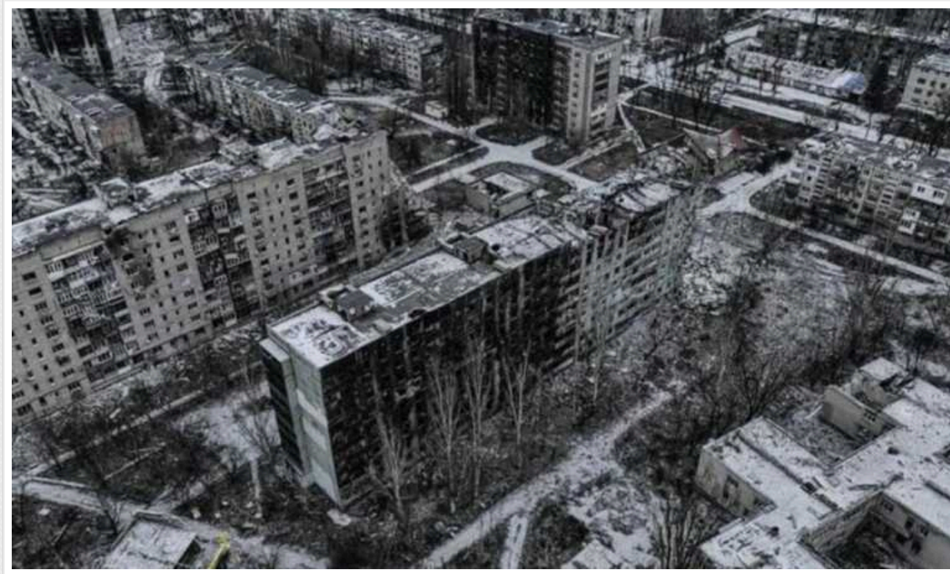
Окупанти намагаються оточити Авдіївку: зайшли у приватний сектор на околиці міста

Російські війська зайшли на околиці Авдіївки у приватний сектор. Армія РФ намагається оточити місто з флангів з півдня та півночі, – начальник МВА Віталій Барабаш.