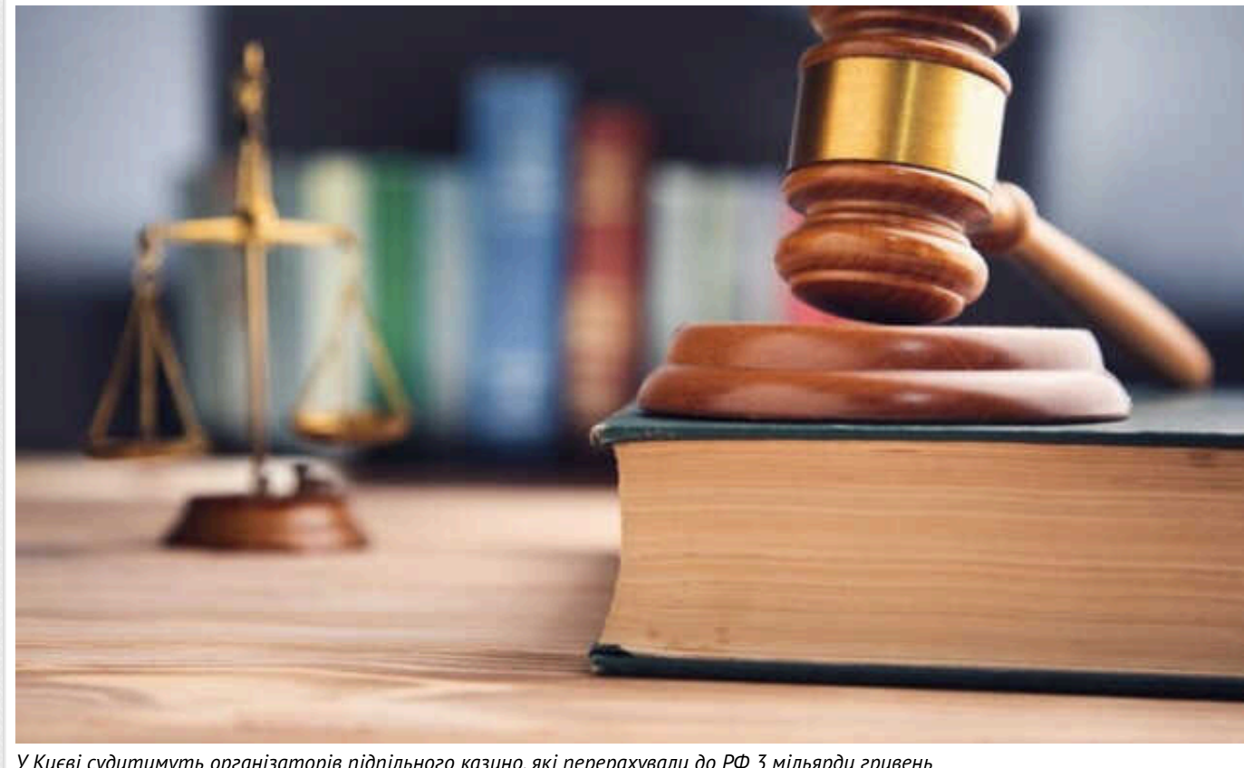
У Києві судитимуть організаторів підпільного казино, які перерахували до РФ 3 мільярди гривень

У Києві правоохоронці скерували до суду обвинувальний акт відносно 10 учасників злочинної організації, яких обвинувачують в організації незаконної діяльності онлайн-казино. Встановлено, що гральні заклади "перерахували" до РФ майже 3 млрд гривень своїх прибутків.