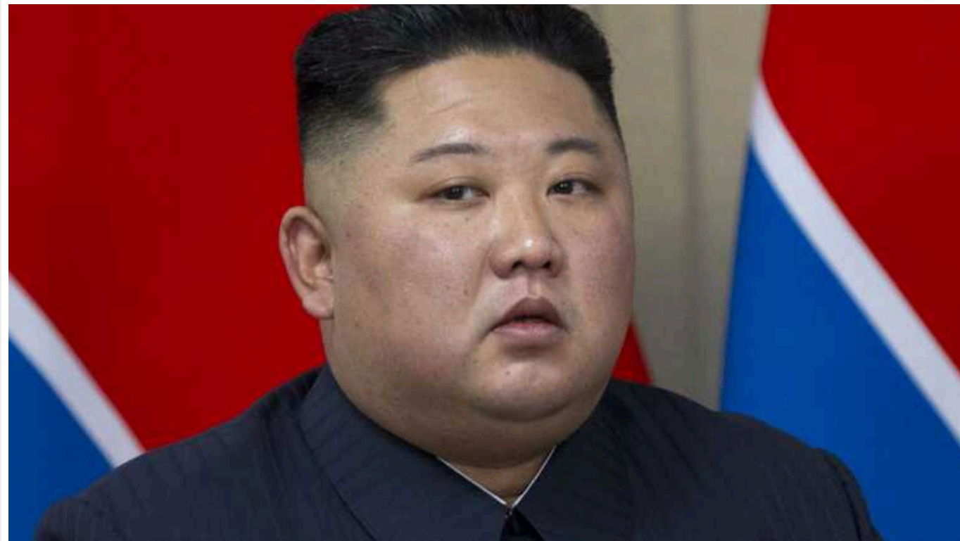
КНДР має законне право знищити Південну Корею, - Кім Чен Ин

Північнокорейський лідер Кім Чен Ин заявив, що має законне право знищити Південну Корею, зробивши останній крок. Він вкотре пригрозив сусіду, виключивши з національної політики своєї держави концепцію мирного об'єднання.