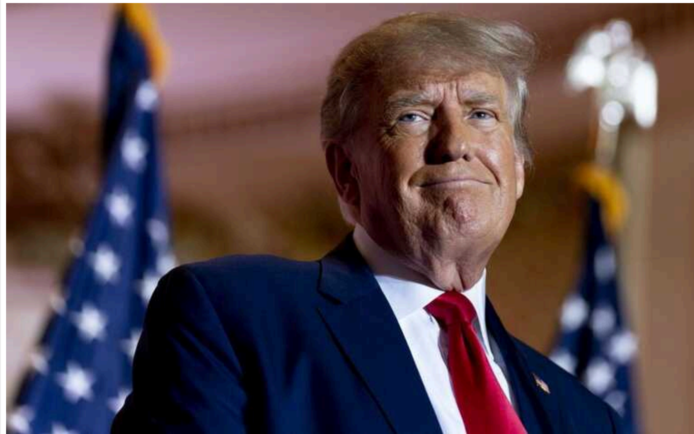
WSJ: В США Верховний суд може поновити право Трампа на участь у виборах

Верховний суд США може відхилити спробу виключити Дональда Трампа зі списку кандидатів у президенти 2024 року.