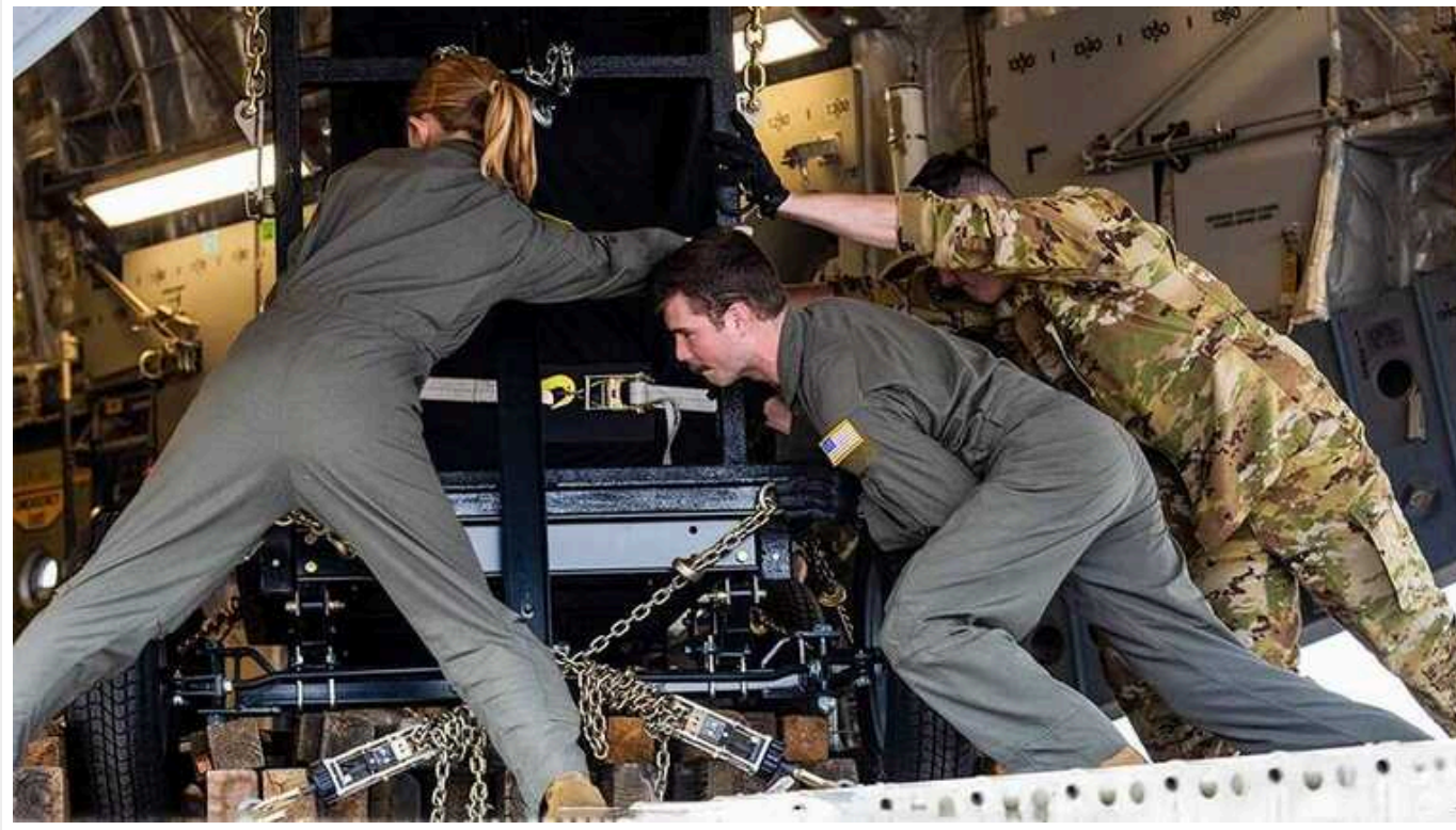
Bloomberg: Без допомоги США Україна може втратити і виплати від МВФ

Продовження західного фінансування є умовою кредитної програми Фонду на 15,6 млрд. доларів. Виділення наступного траншу на 900 млн дол. почнуть розглядати вже цього місяця.