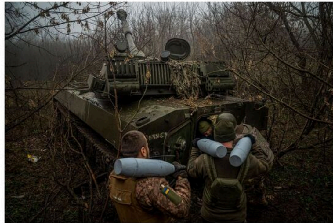
Ukrainian artillery in Donetsk region, Ukraine.

By Volodymyr Verbianyi , Daryna Krasnolutska , and Eric Martin