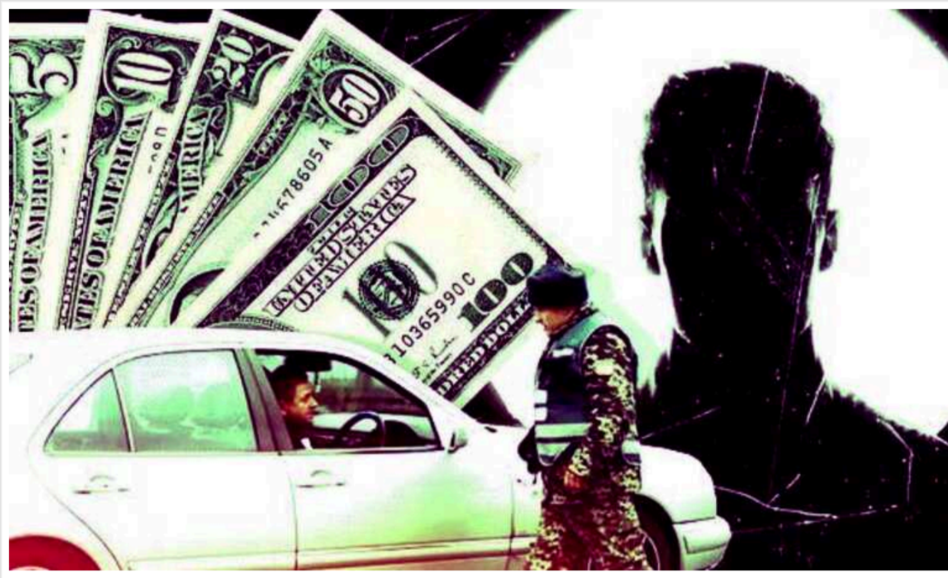
Корупційна система "Шлях": Чому держава не карає за вивезення ухилинтів з України

За майже два роки Великої війни судова система винесла 80 вироків відносно сотні організаторів схем з переправлення ухилинтів за кордон. Лише кожна десята справа завершилася для обвинувачених позбавленням волі.