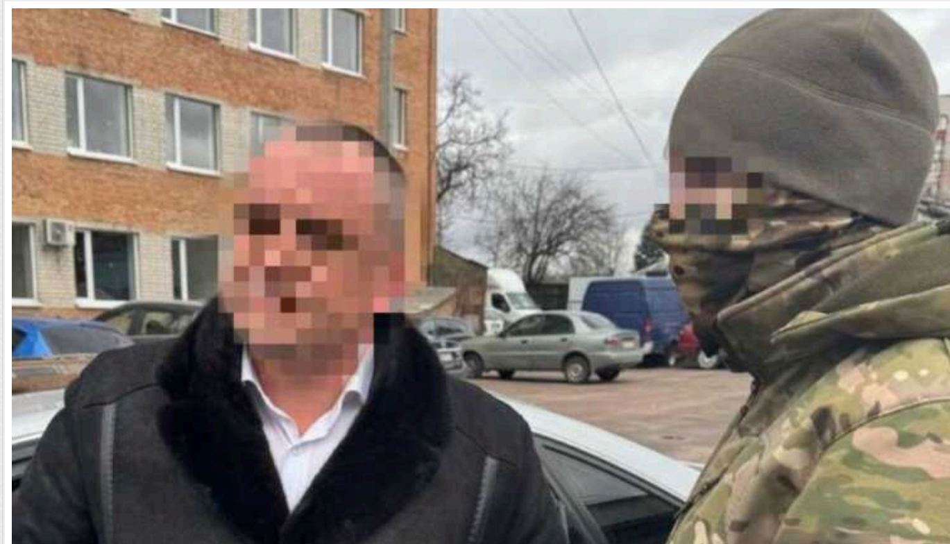
У Київській області затримали керівника міжрегіонального управління держпраці

На Київщині викрито керівника і начальника управління одного з міжрегіональних управлінь державної служби з питань праці та двох посередників викрито на вимаганні та одержанні хабаря (ч. 3 ст. 368 КК).