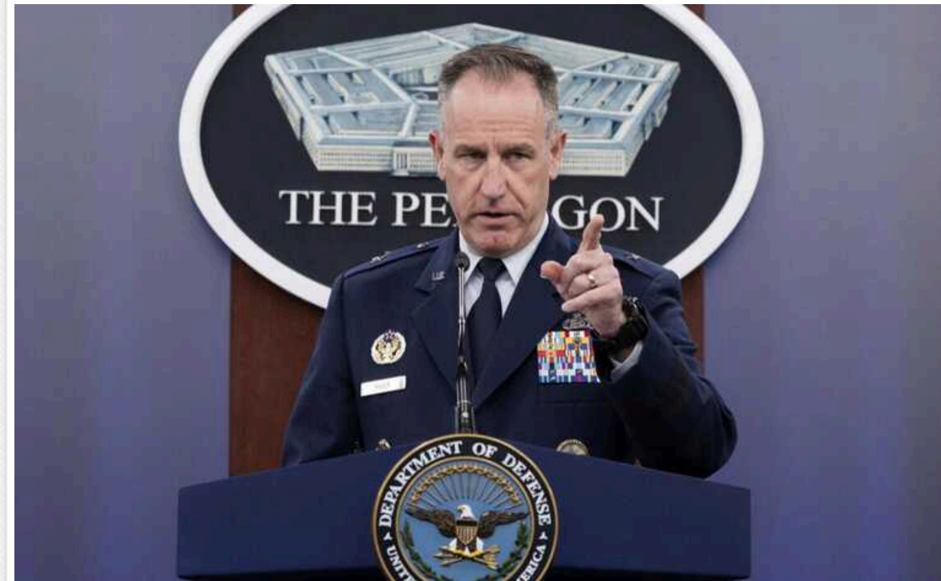
В Пентагоні пообіцяли, що Сполучені Штати продовжать поставки озброєнь для ППО України

Речник Пентагону Патрик Райдер заявив, що США продовжуватимуть постачати Україні озброєння для системи протиповітряної оборони (ППО).