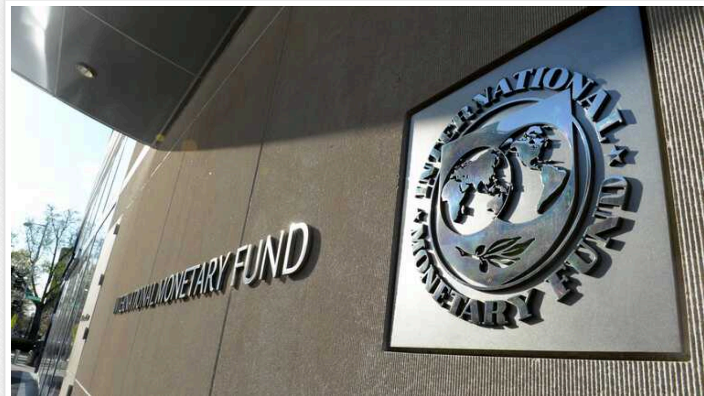
МВФ: Ситуація в Червоному морі поки не позначається на світовій економіці

У Міжнародному валютному фонді вважають, що ситуація з обстрілом суден у Червоному морі поки не позначається на світовій економіці.