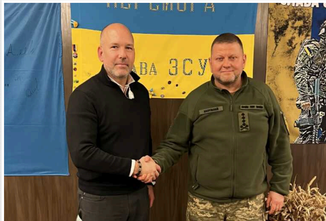
Світовий Конгрес Українців подякував Залужному: Він зупинив "другу армію світу"

Світовий Конгрес Українців подякував генералу Валерію Залужному за віддану службу народу України.