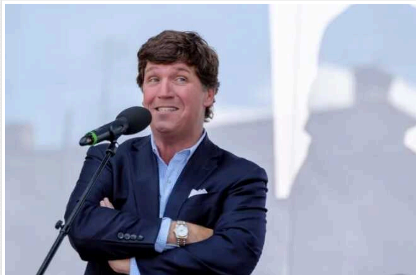
У Білому домі закликали не піддаватися на брехню Путіна в інтерв'ю Карлсону: "Україна ніколи не становила загрози"

Росія розв'язала повномасштабне вторгнення в Україну без провокації з української сторони. Пропагандистське інтерв'ю кремлівського диктатора Володимира Путіна скандальному журналісту Такеру Карлсону не треба "брати за чисту монету".