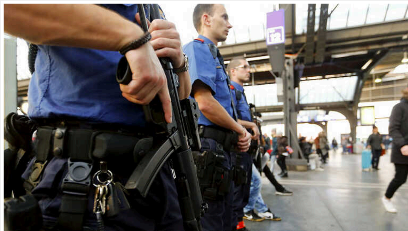
Швейцарська поліція вбила озброєного сокирою чоловіка, який захопив заручників у поїзді

Швейцарська поліція повідомила, що 32-річний іранський шукач притулку, озброєний сокирою і ножем, утримував 15 заручників у поїзді на заході Швейцарії протягом майже чотирьох годин, поки поліція не увірвалася до поїзда і не вбила його.