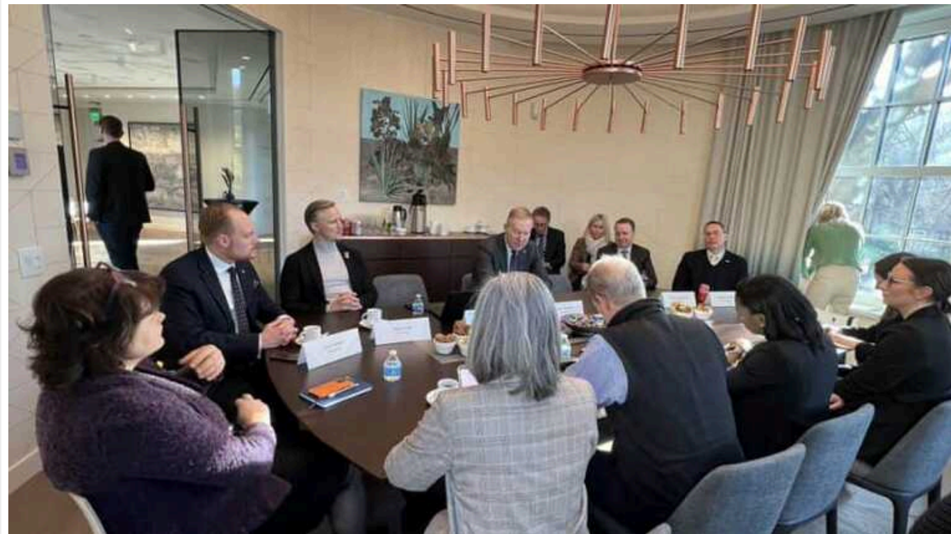
Парламентарі Північної Європи та країн Балтії висловили в США занепокоєння щодо допомоги Україні

Високопоставлені законодавці з країн Північної Європи та Балтії, які відвідали Вашингтон у четвер, висловили занепокоєння тим, що вони назвали відсутністю терміновості та чіткої стратегії з боку США щодо допомоги Україні в боротьбі з московським вторгненням.