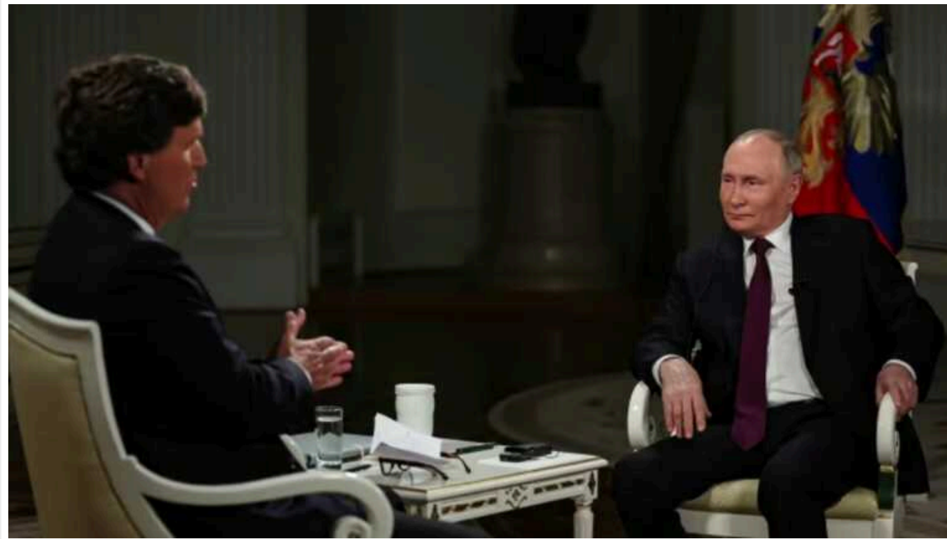
ISW проаналізував інтерв'ю Путіна: брехав і намагався зробити з себе жертву

Інститут вивчення війни проаналізував інтерв'ю російського диктатора Володимира Путіна "американському Соловійову" і дійшов висновку, що президент РФ використав його для поширення брехні, перекручування історії і для того, щоб виставити Росію жертвою, а не агресором, як це є насправді.