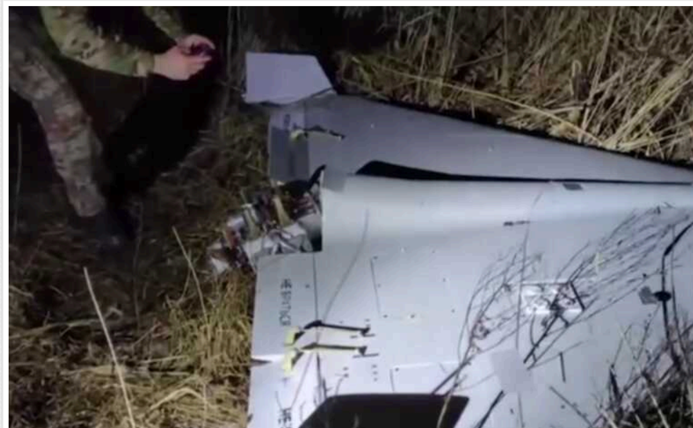
Нацполіція показала "шахед", який впав на Дніпропетровщині і не вибухнув

Під час чергової російської атаки українські оборонці неба «приземлили» ударний безпілотник. Він упав на пустирі біля села Дніпропетровської області. Після збиття дрон залишився майже неушкоджений.