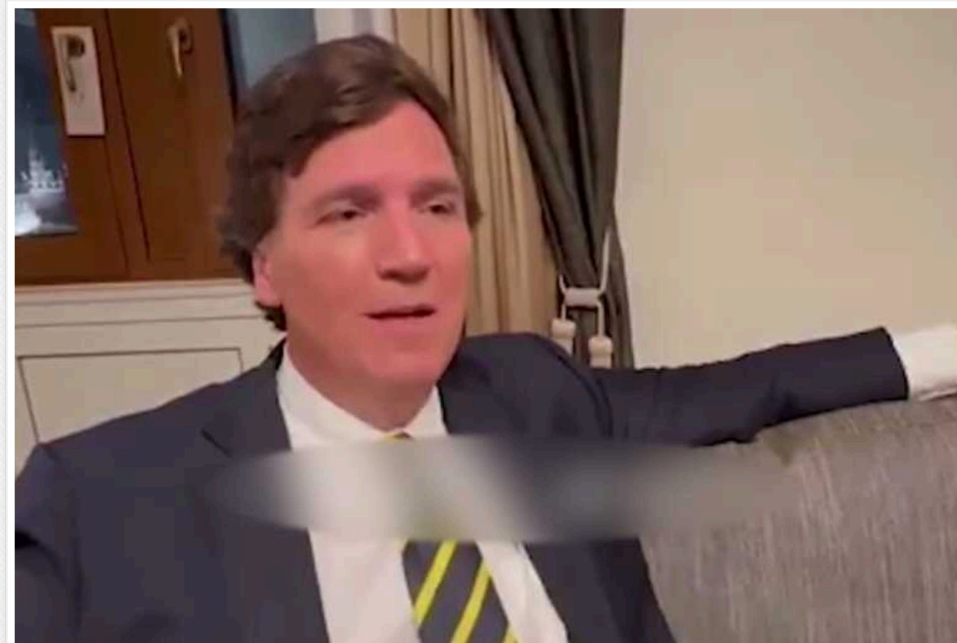
Путін готовий застосувати ядерну зброю, якщо потрібно буде утримати Крим, – Такер Карлсон

Путін застосує ядерну зброю, якщо потрібно буде утримати Крим, заявив американський журналіст Такер Карлсон після інтерв'ю із президентом РФ.