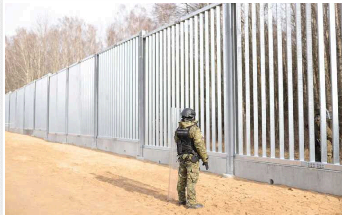
У Польщі планують ущільнити загородження на кордоні з Білоруссю

Керівництво МВС Польщі, спільно з новим керівництвом Прикордонної служби країни, працює над ущільненням загородження на польсько-білоруському кордоні.