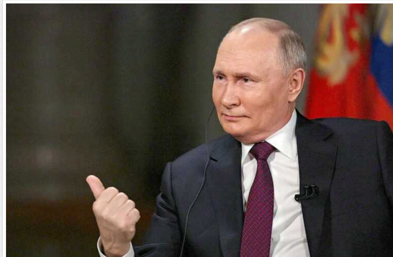
Путін у інтерв'ю Карлсону зганьбився фейком про батька Зеленського, який "воював з фашистами"

Президент РФ Володимир Путін в інтерв'ю американському телеведучому Такеру Карлсону видав недолугий фейк про батька Президента України Володимира Зеленського. Він заявив, що нібито у розмові із Зеленським пацікавився, як той може "підтримувати неонацистів", маючи "батька-фронтовика", який воював із нацистами під час Другої світової.