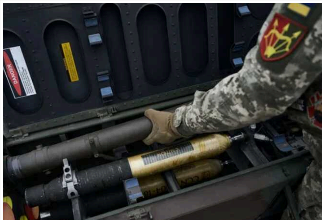
Війна в Україні не є "вічною" для США і насправді підвищує боєготовність американців, – ISW

Україна не є "вічною війною" для США, бо американці не ведуть цієї війни. А відправлення допомоги Києву лише підвищує військову готовність Штатів та знижує ризик того, що їм доведеться самим воювати з Росією.