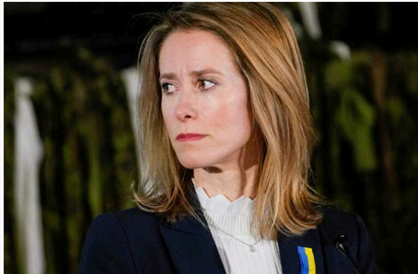
Прем'єрка Естонії Каллас сказала, який об'єм допомоги необхідний Україні для перемоги у війні проти Росії

Військова сила держав, які входять до коаліції з підтримки України, в 13 разів більша за ту, яку має країна-агресор Росія. Тож якщо ці партнери нададуть Києву хоча б по 0,25% свого ВВП, це створить поворотний момент у війні та забезпечить українцям перемогу.