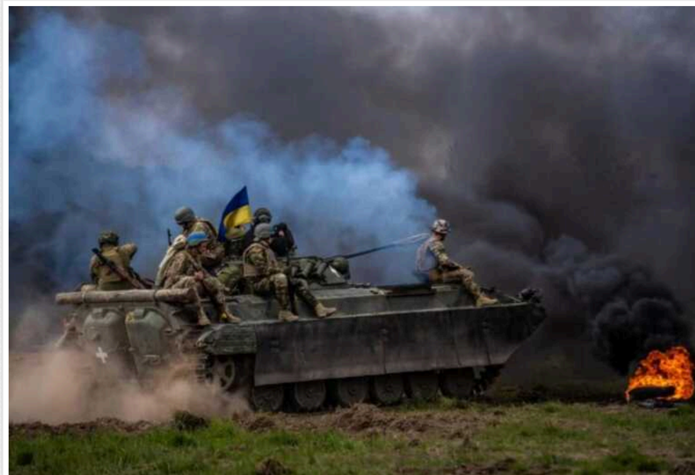
За два роки війни Україна досягла значних успіхів, а РФ – невдач, – посол США в ОБСЄ

За майже два роки повномасштабного вторгнення російських військ Україна досягла значних успіхів як на полі бою, так і на дипломатичному фронті. Водночас державо-агресор Росія зазнає лише поразок і невдач, хоч і намагається ретельно це приховати.