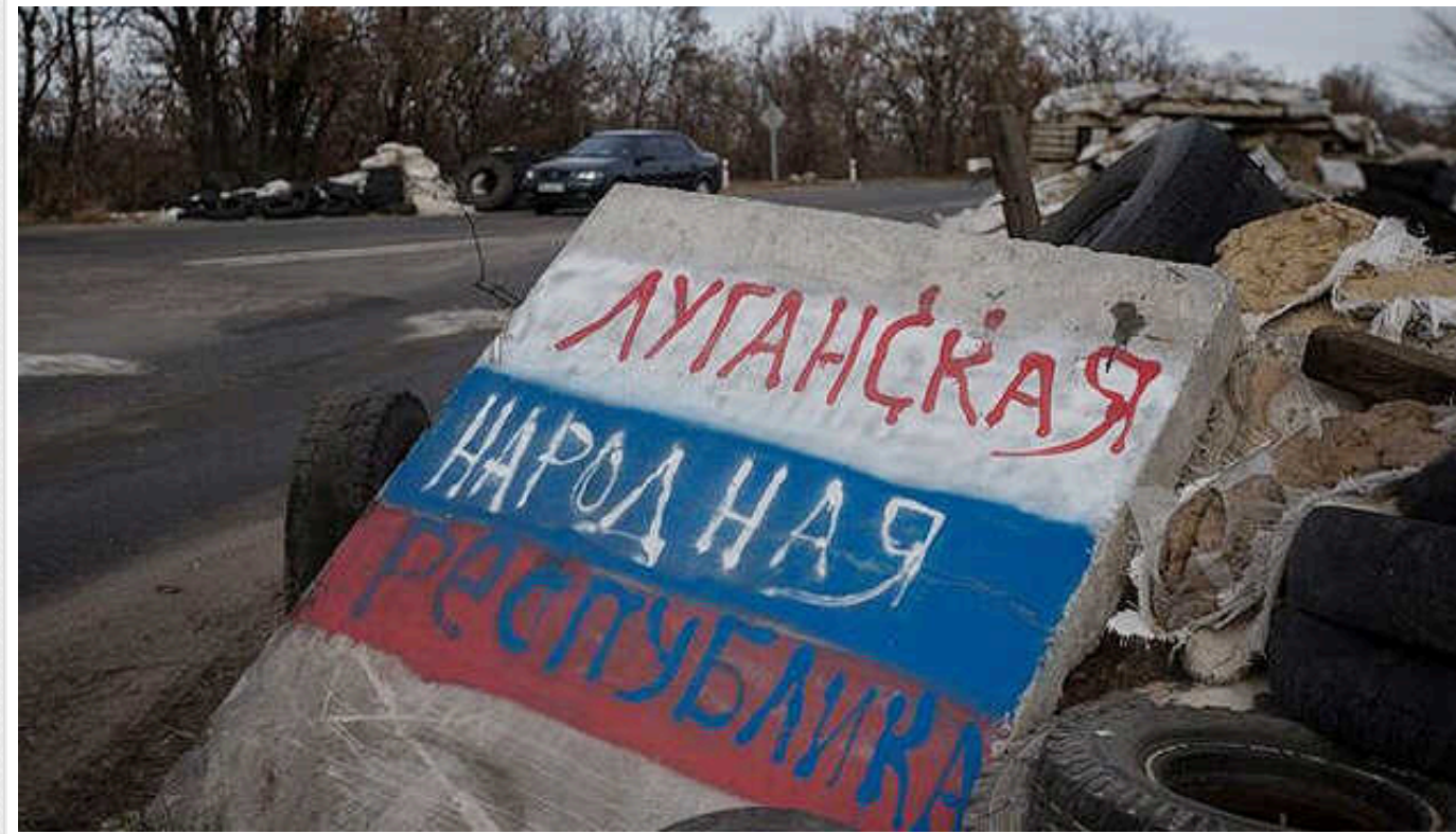
СБУ на захопленій Луганщині викрила ще 16 «народних обранців»

Лише за останній місяць повідомлення про підозру у колабораційній діяльності отримали 16 так званих «депутатів» місцевих «советов муниципальных образований».